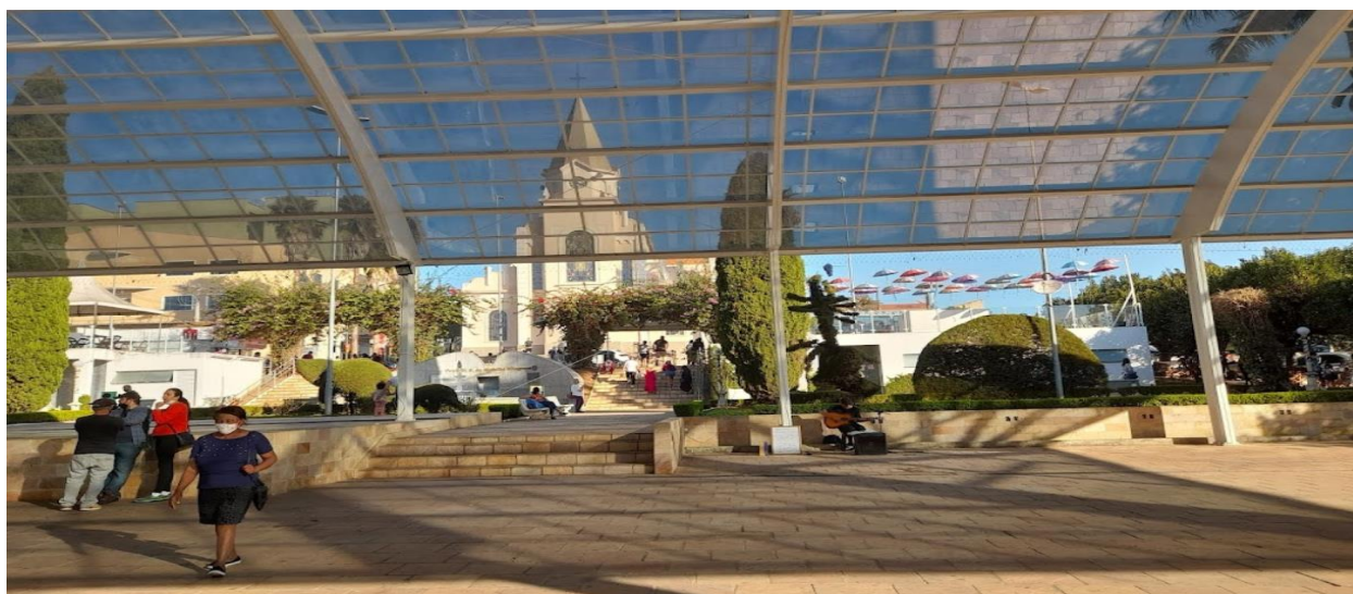
Imagem 1 – Praça Prefeito Mário Zucato

Assim, verifica-se o local onde serão realizados a maioria dos eventos (mediante relatório fotográfico) para fins e organização do estudo: