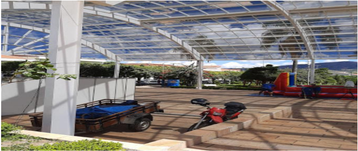
Imagem 3 – Praça Prefeito Mário Zucato