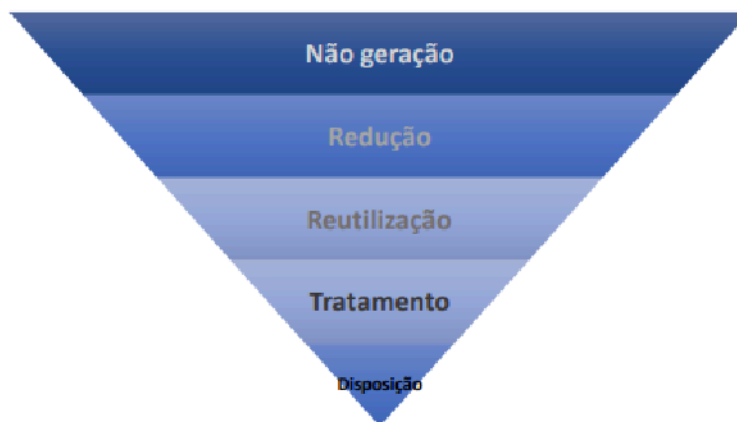
Imagem 02 Sustentabilidade em Obras e Serviços de Engenharia