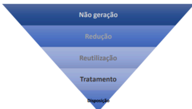
Imagem 03 Sustentabilidade em Obras e Serviços de Engenharia