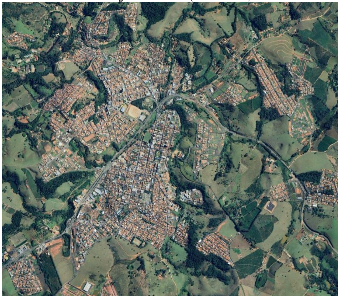
Imagem 02 Zona central (Monte Sião-MG)

Rua Maurício Zucato, 111 – Centro, Monte Sião/MG. CEP 37580-000 Telefone (35) 3465-4600 – email: nucleocompras@montesiao.mg.gov.br