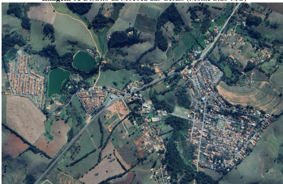
Imagem 01 Distrito da Mococa das Gerais (Monte Sião-MG)

Temos que a área territorial de Monte Sião–MG, é de aproximadamente 291,594 km 2 , conforme indica o Instituto Brasileiro de Geografia e Estatística (IBGE), dessa metragem, cerca de 10,79 km 2 fazem parte do perímetro urbano, logo, a extensão rural chega a aproximadamente 280,8 km 2 segundo os dados levantados nos arquivos desta prefeitura. Como também temos um levantamento de 2013, que indica que as estradas vicinais do município possuem cerca de 298,36 quilômetros lineares, dando uma dimensão da primordialidade não só desta, mas também de demais contratações relacionadas às locomoções e prestações de serviço em geral.