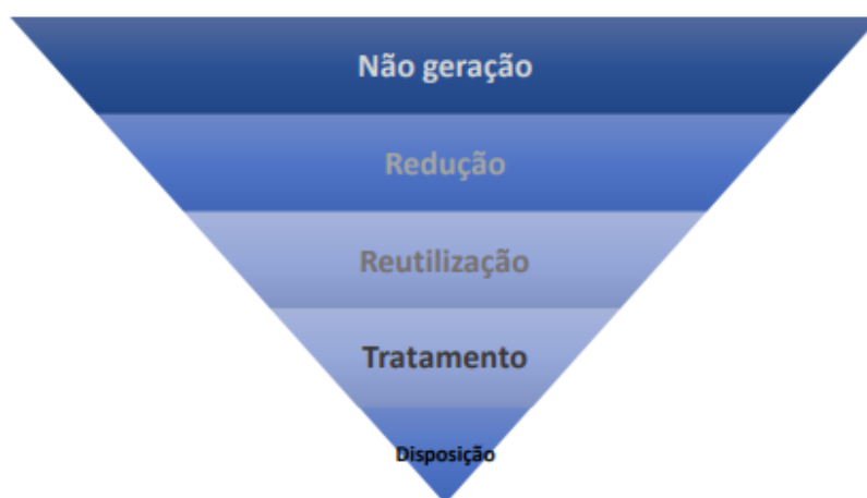
Imagem 03 Sustentabilidade em Obras e Serviços de Engenharia