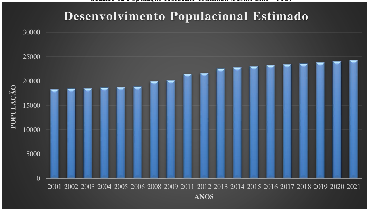
Gráfico 01 População residente estimada (Monte Siao – MG)

Telefone (35) 3465-4250 – e-mail: dpobras@montesiao.mg.gov.br